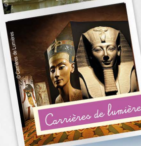
Carrières de lumières