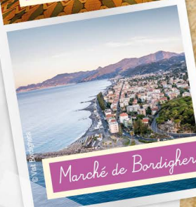
Marché de Bordighera