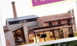
Musée Terra Rossa

Tente cristal sur la place de la République Tarif : 30€/personne, repas compris.