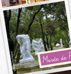
Musée de Faykod