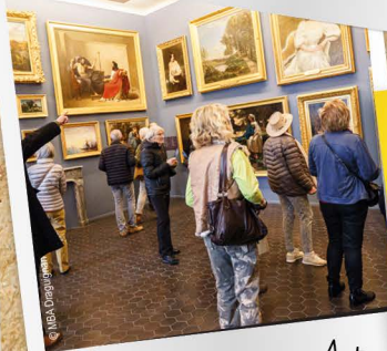
Musée des Beaux-Arts